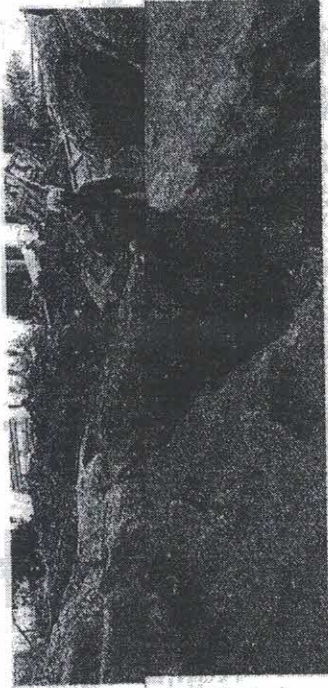
Jerusalém descobriu uma grande aldeia agrícola judia datada de 2 milênios. Arqueólogos desenterraram diversos objetos, como jarros, locais de banhos e rituais