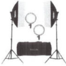
ACESSÓRIOS ELETRÔNICOS, CÂMERAS, ELETRÔNICOS MLG-065