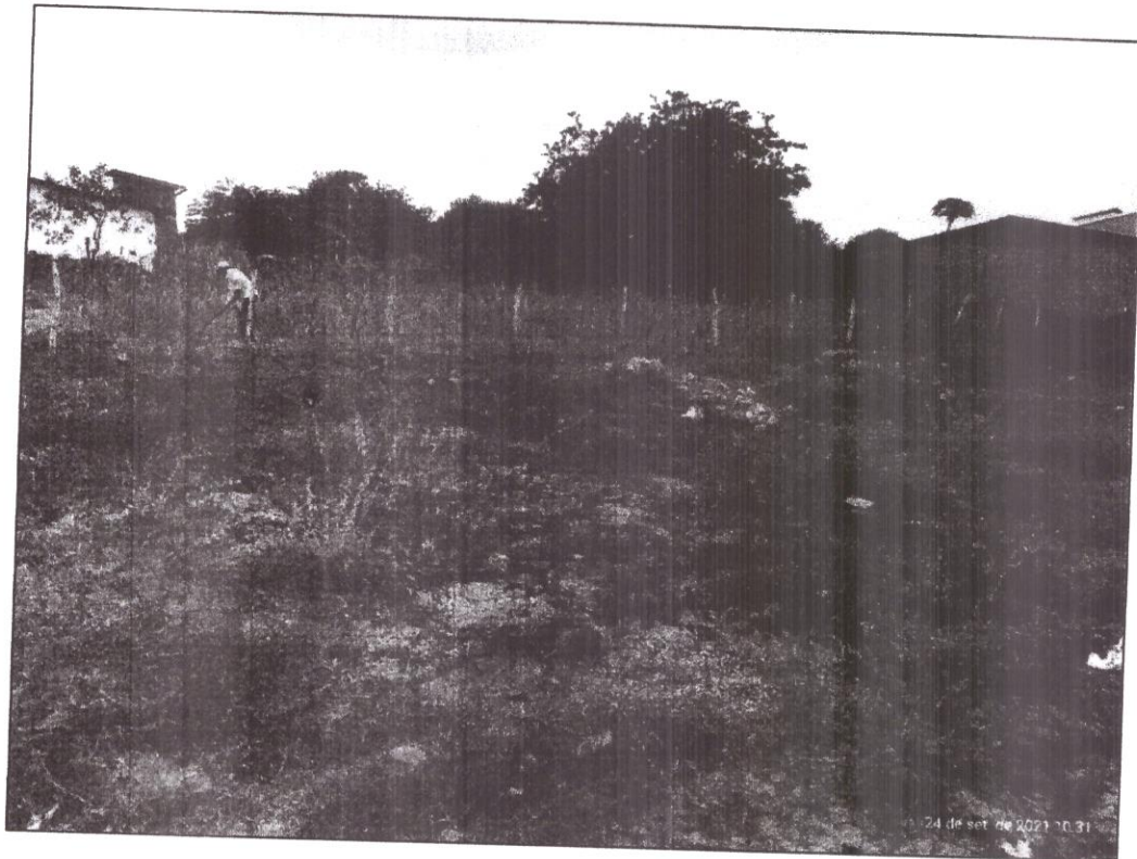
Figura 4 - TERRENO JUREMA DOS VIEIRAS - 556831.1900 / 9492475.0600