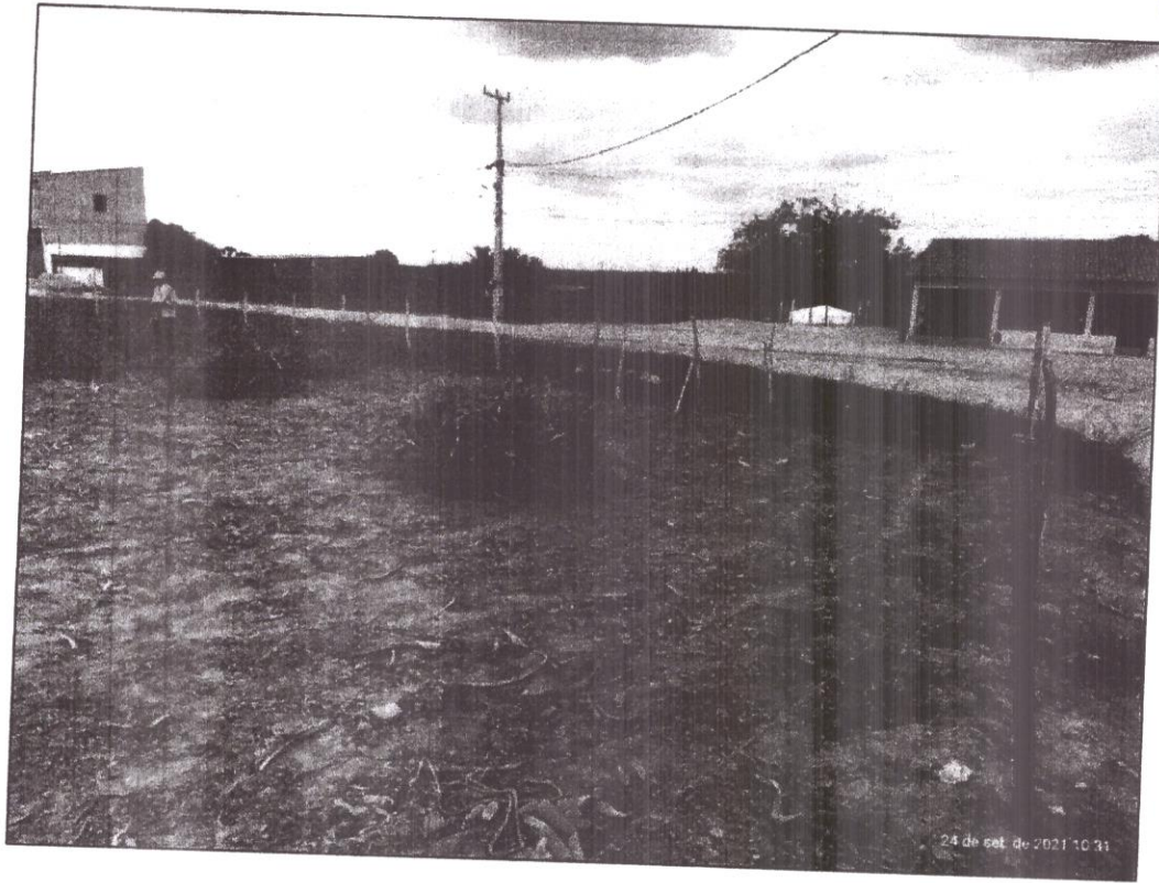
Figura 3 - ACESSO - 556831.1900 / 9492475.0600

PREFEITURA MUNICIPAL DE OCARA CPL Nº 839