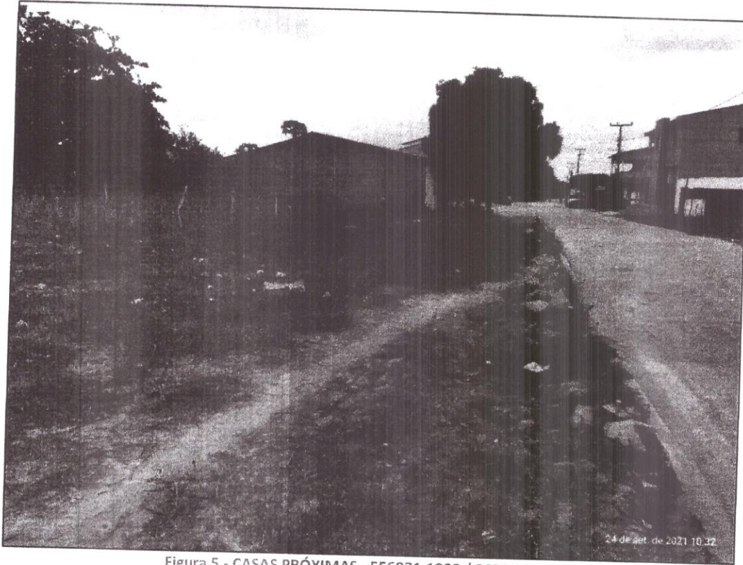
Figura 5 - CASAS PRÓXIMAS - 556831.1900 / 9492475.0600

PREFEITURA MUNICIPAL DE UGARÁ - C. P. L. N.º 810