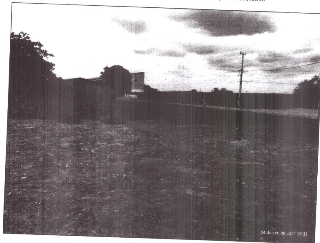
Figura 2 - LIMITE COM TERRENO VIZINHO - 556831.1900 / 9492475.0600