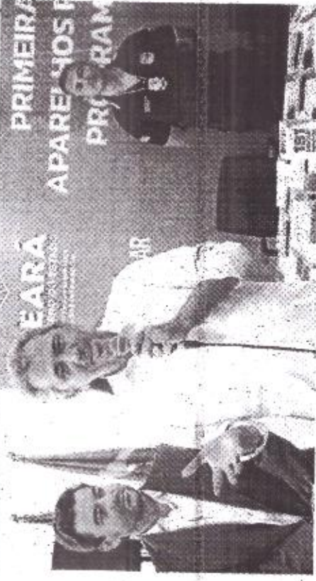
ELMANO evitou responder críticas de Sarto

THAYS MARIA SALLES thays.salles@opovo.com.br